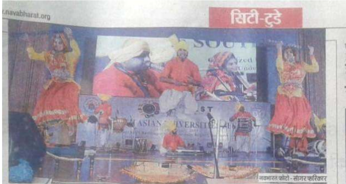
नवभारत फोटो - सोनार फरिदार