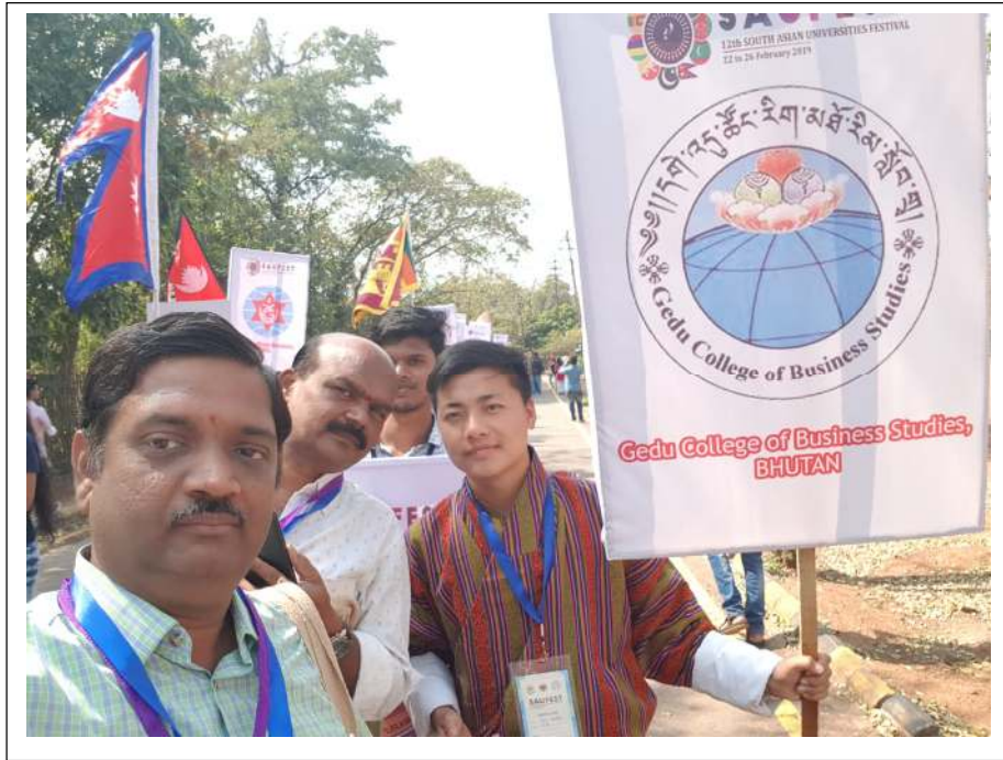
SCSVMV REPRESENTING INDIA