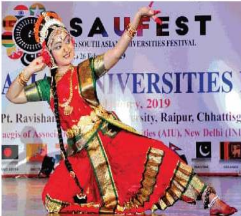
तमिलनाडु की कलाकार प्रस्तुति देती हुई। कुरुक्षेत्र, विद्यासागर यूनिवर्सिटी कोलकाता, पंजाब यूनिवर्सिटी

रायपुर। नईदुनिया प्रतिनिधि साथ एशियन यूनिवर्सिटीज फेस्टिवल का दूसरा दिन लोक आर्केस्ट्रा के नाम रहा। पं. रविशंकर शुक्ल विरविद्यालय के तत्वावधान में साइंस कॉलेज ऑडिटोरियम में कराए जा रहे इस आयोजन में भारत के विभिन्न विरविद्यालयों के युवाओं के अलावा श्रीलंका, बांग्लादेश समेत कई अन्य देशों के सांस्कृतिक दूत अपनी कला का जबरदस्त प्रदर्शन कर रहे हैं। आयोजन के दूसरे दिन शनिवार को त्रिभुवन यूनिवर्सिटी काठमांडू, नेपाल, साथ इस्टर्न यूनिवर्सिटी ऑफ श्रीलंका आलुविल, अमरावती यूनिवर्सिटी, तेजपुर यूनिवर्सिटी असम, कुरुक्षेत्र यूनिवर्सिटी