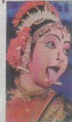
सौटियां बनती रही, अपने ही देश नहीं, दूसरे देशों के प्रतिभागियों की अच्छी