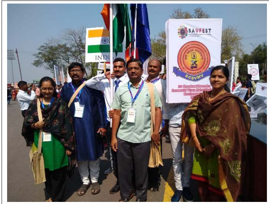
SCSVMV team below with Hon'ble Chief minister of Chattisgarh