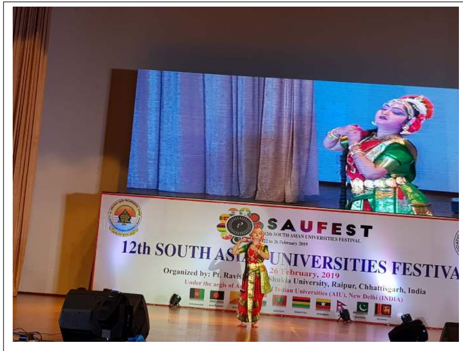
SCSVMV team below with Hon'ble Vice Chancellor of Pandit Ravisankar Sukhla University